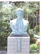
(休館日 毎週火曜日・年末年始)